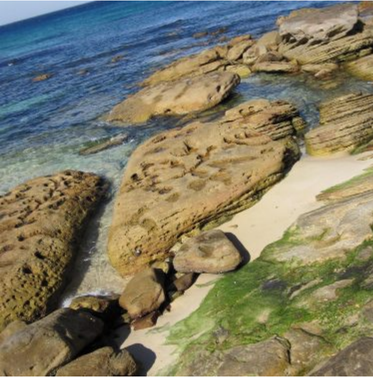
Steine Strand Sydney