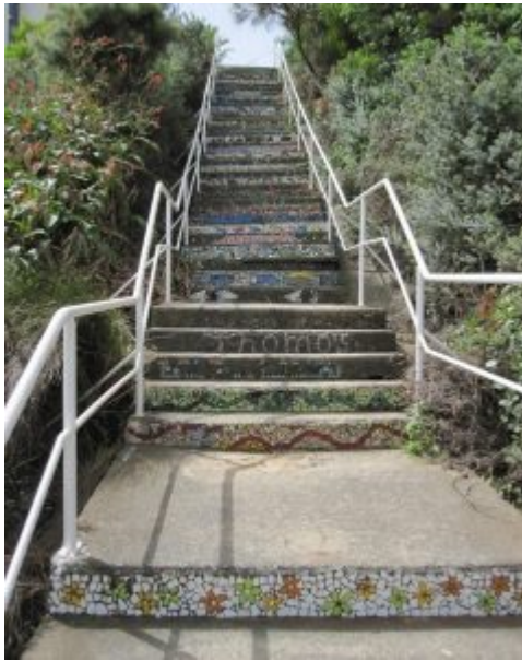
Mosaik Treppe – Sydney – ohne Filter, #nofilter