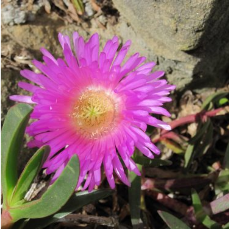
Blume Strand Sydney