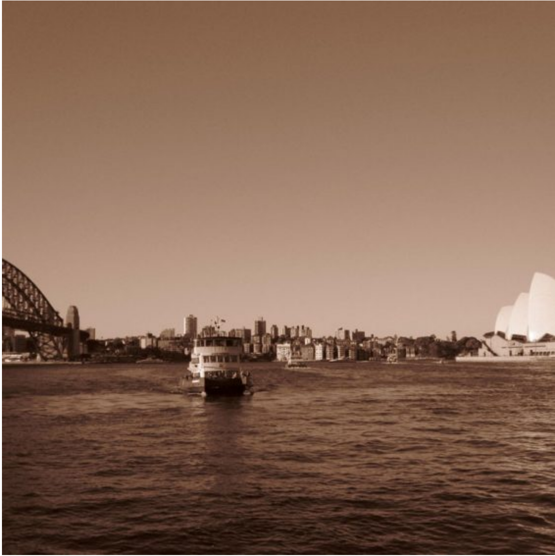
Sydney 2009 Oper