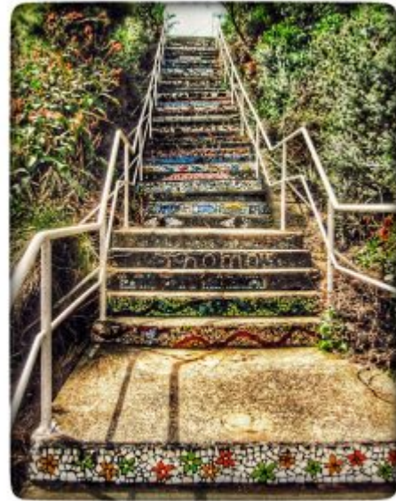
Mosaik Treppe – Sydney – mitFilter, #filter