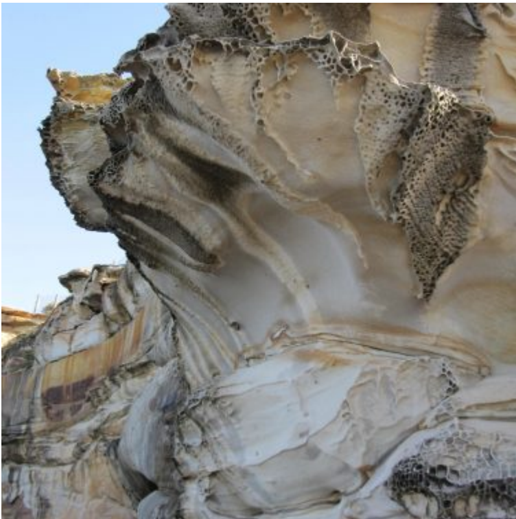
Steine Strand Sydney