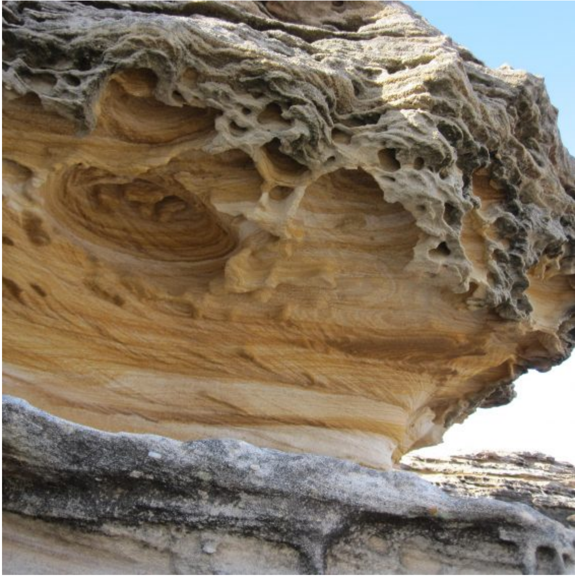
Steine Strand Sydney