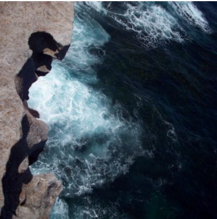
Klippe Strand Sydney