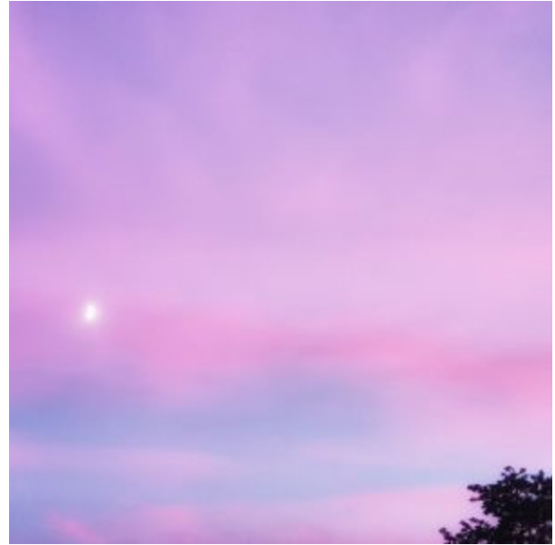
Himmelsrot Berlin – mit Filter, #filter